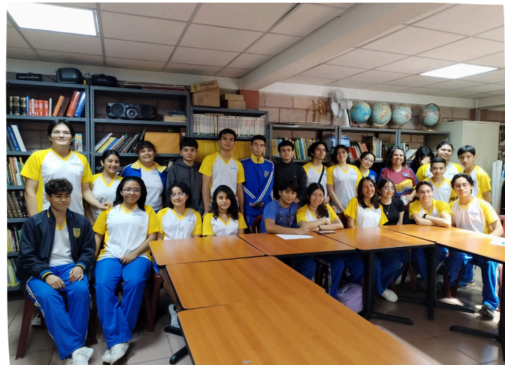
Entre los asistentes a la primera reunión del Club de Lectura que atendieron la invitación hubo jóvenes de secundaria.

Si tú eres un lector y te gustaría compartir con más personas acerca de lo que lo que nos hablan las páginas de diferentes lecturas, estás invitado a participar, las puertas del Club de Lectura están abiertas a recibir más miembros.