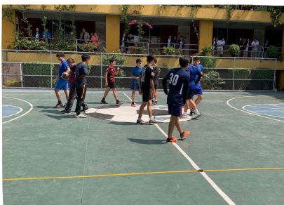
PARTIDO ENTRE 4TO CCLL Y 3RO

¡FUE UN DÍA INOLVIDABLE LLENO DE EMOCIONES Y TRIUNFOS PARA LOS EQUIPOS PARTICIPANTES!