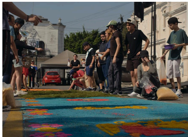
Avance de la alfombra después de 2 horas de trabajo en equipo.

comunitarios y compartir tradiciones culturales. Por parte de toda la institución educativa se agradece de corazón a los padres de familia por su apoyo en materiales y por estar presentes durante la actividad.