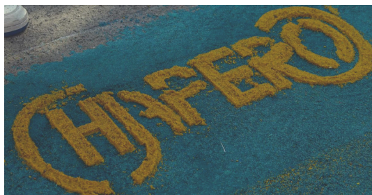
El molde utilizado para hacer el logotipo del colegio fue realizado por 5to. Bach. en CCLL.

El pasado 22 de marzo de este año, los alumnos de Quinto Bachillerato tuvieron la oportunidad de participar en la creación de una alfombra en el atrio de la iglesia de Santo Domingo. Esta actividad les permitió conocer más sobre la cultura guatemalteca y el arte efímero realizado con aserrín teñido.