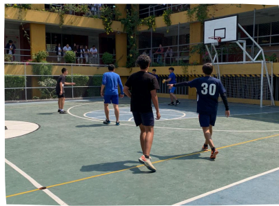
PARTIDO ENTRE 4TO CCLL Y 3RO

En los torneos interaulas de baloncesto, quinto grado femenino se alzó con la victoria sobre cuarto en Computación en un partido lleno de intensidad y habilidad.